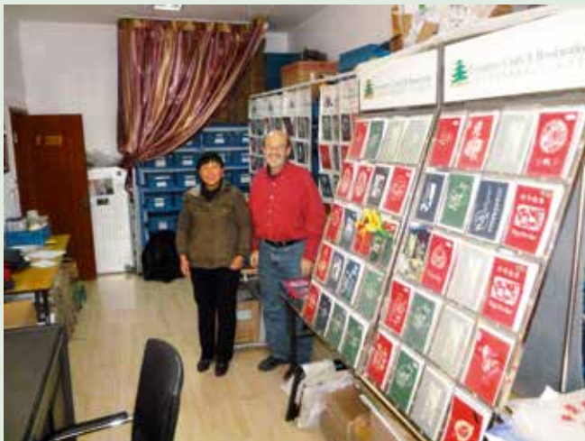
Kort-produksjonen gir arbeid til fattige kvinner.

Vi har støttet denne organisasjonen helt siden starten og er glade for de mulighetene som har åpnet seg takket være innsatsen til en tidligere utsendt medarbeider. Vær med å be om at forholdene igjen må legge seg til rette slik at dette viktige arbeidet fremdeles kan vokse og bli til velsignelse for de som virkelig trenger det.