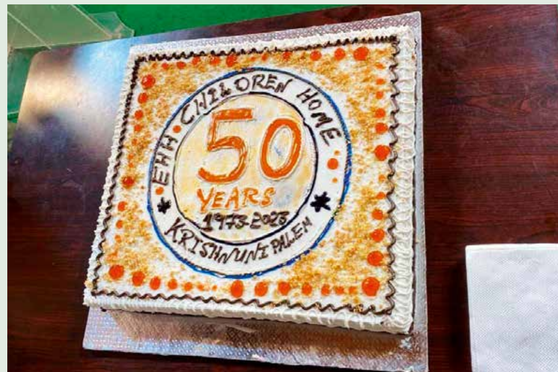
Vakkert pyntet jubileumskake.