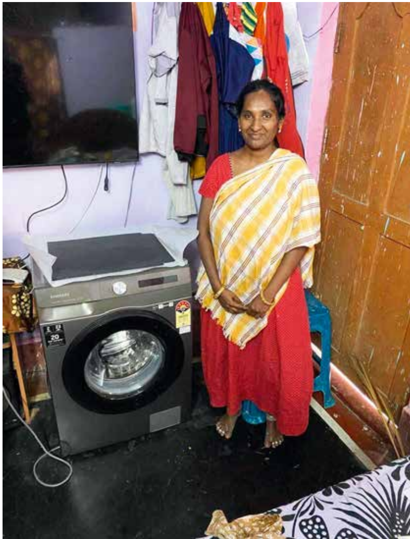
Fornøyd syerske som har kjøpt vaskemaskin for inntjeningen.