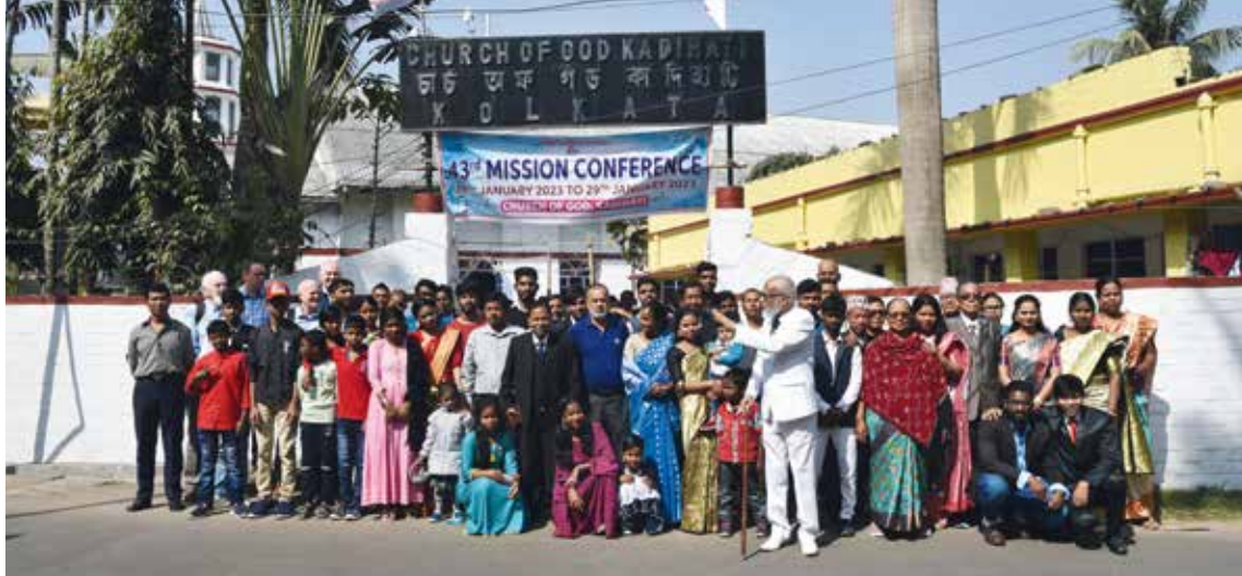
Misjonskonferanse hos CDF i Kolkata.