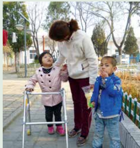
Noen av barna som har fått hjelp gjennom arbeidet til Evergreen.