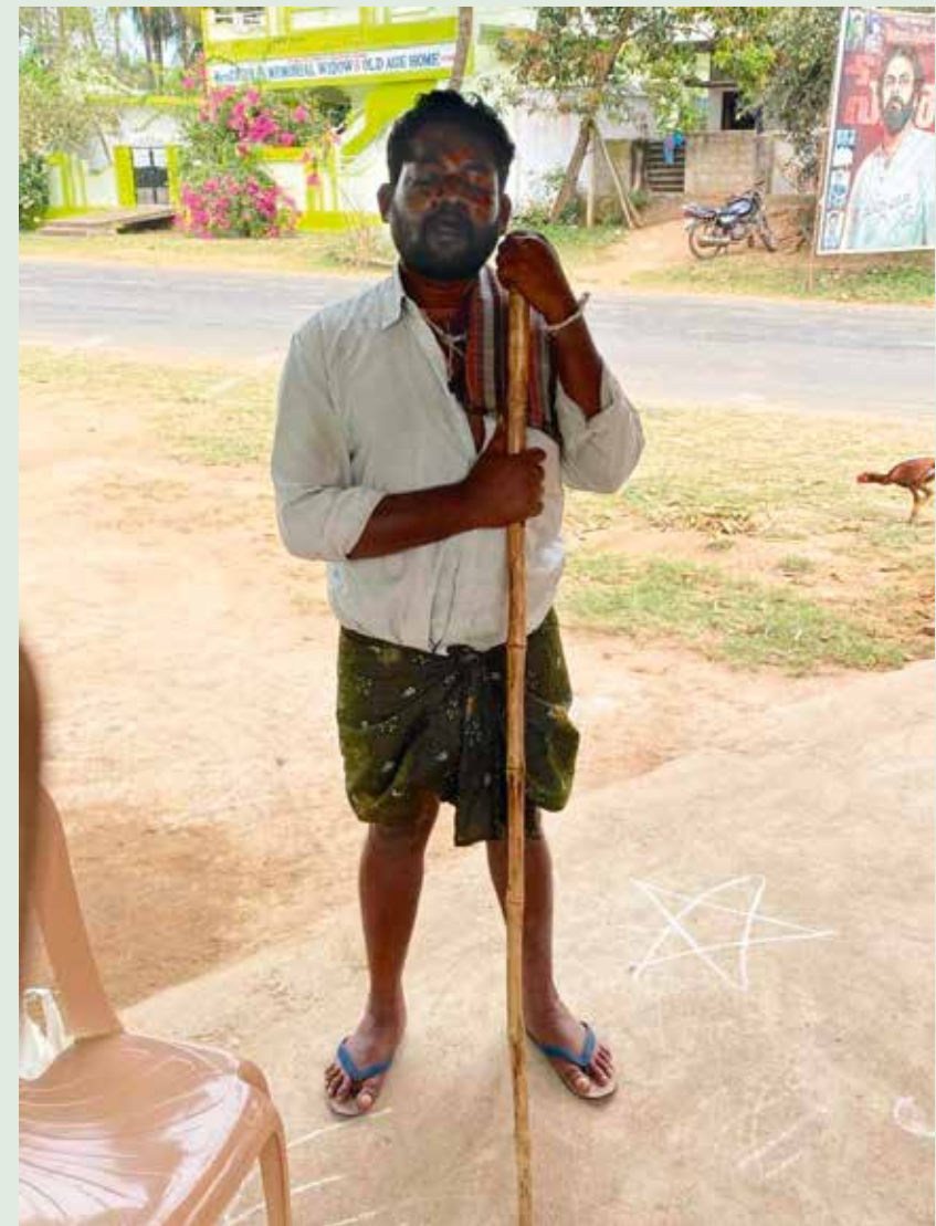
Blind mann som får mat gjennom vårt arbeid.

For pengene hun hadde tjent hadde hun kjøpt seg en vaskemaskin. Dette gjorde hverdagslivet langt lettere for henne, og gav henne mer tid til det hun virkelig hadde lyst til, nemlig å sy. Det nytter det vi driver med.