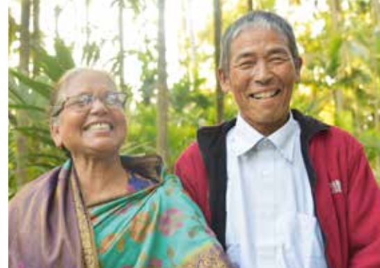
Pastorpar i Nepal.

På underlig og mirakuløs måte fikk han mulighet til å dra på en ungdomskonferanse i Sverige i 1973. Han fikk indisk pass i løpet av tre dager, noe som normalt ville ta flere måneder på den tiden. Han fikk dessuten penger til flybillett i løpet av de samme tre dagene. – Da jeg landet i Sverige hadde jeg bare 18 dollar i lomma. Det var forresten alt jeg eide. Men heldigvis, og som en Guds ledelse, traff jeg et kristent ektepar på flyet. De skulle også til Sverige. Jeg fikk overnatte første natten hos dem, og de hjalp meg videre til konferansen, forteller han og fortsetter: – Talere på konferansen var broder Andreas fra Åpne dører og Loren