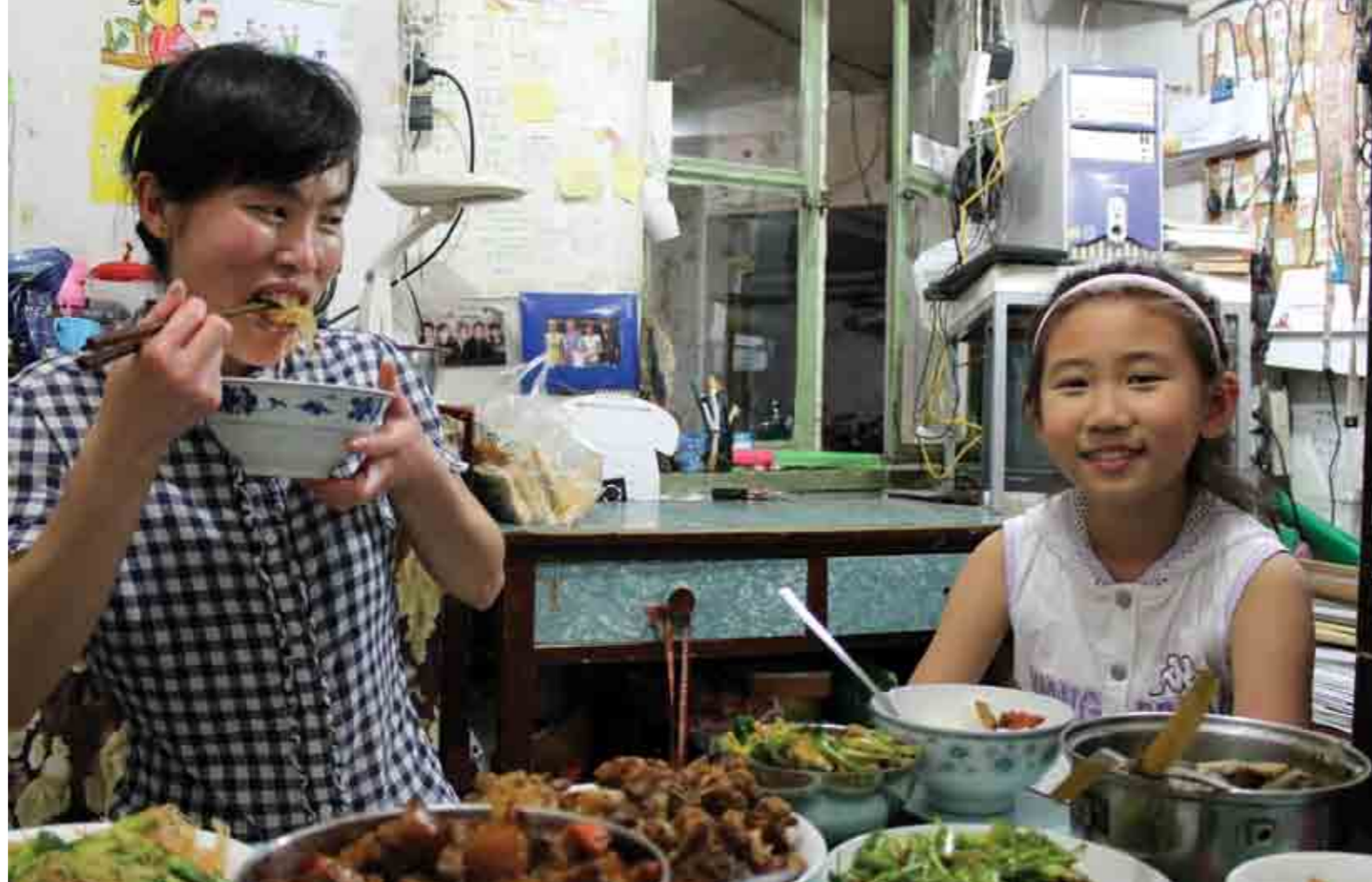
Mamma er kjempestolt av datteren de fant. Selv vet hun ingenting.