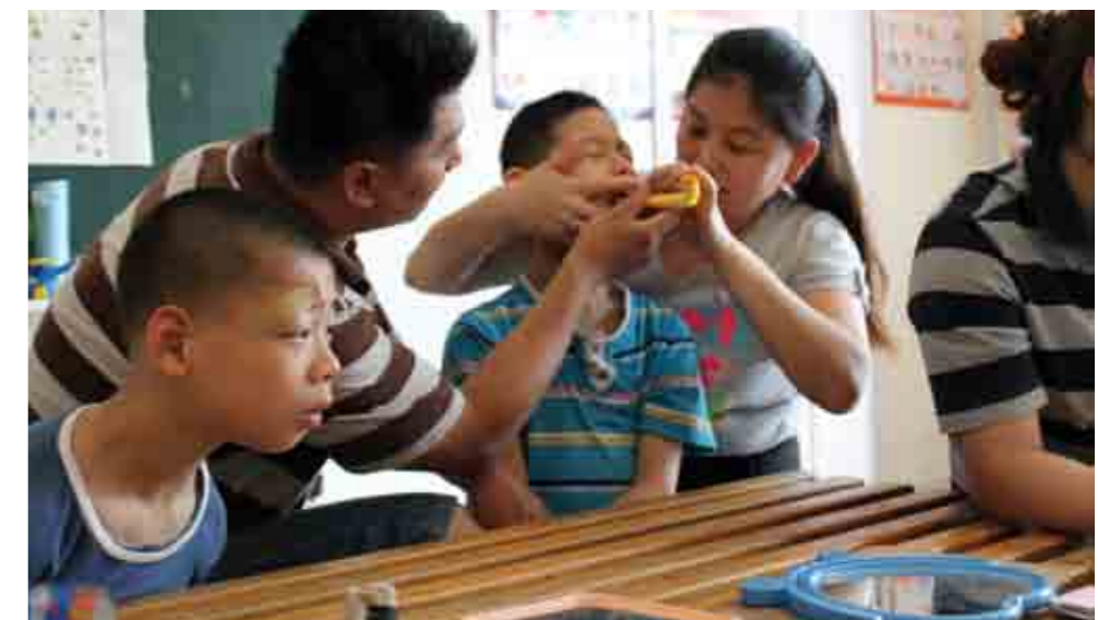
Hver dag øves det i timesvis på å uttale ord og lyder. Det er ikke så enkelt.