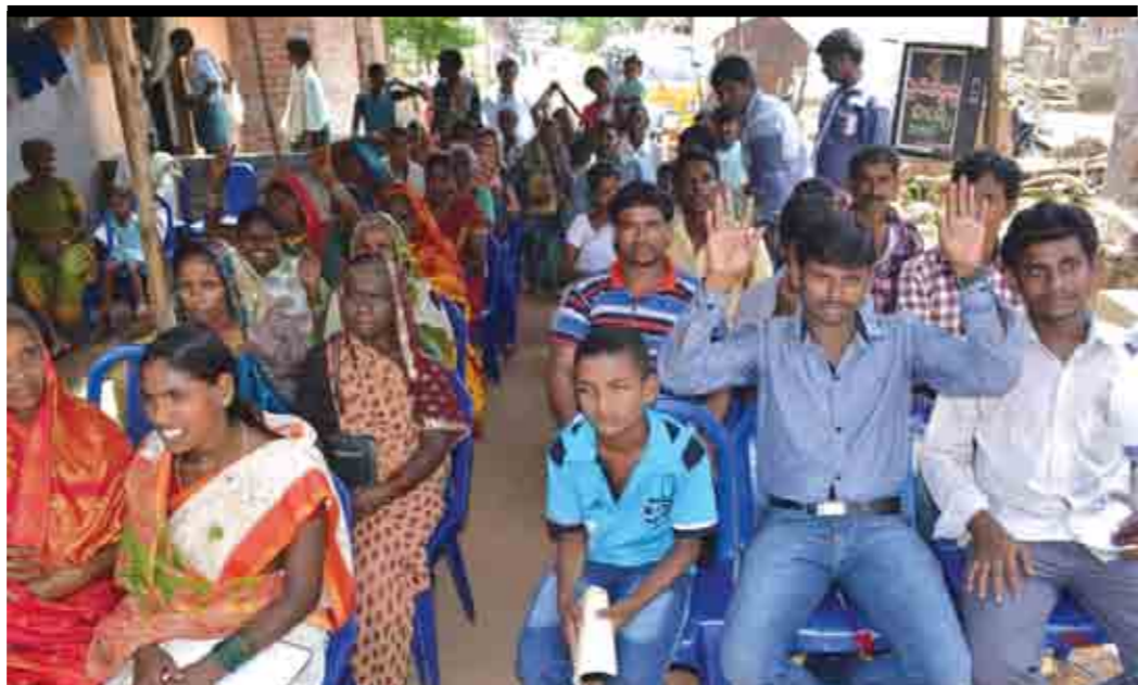
Unge og eldre i en jungelforsamling i det indre av Visakhapatnam-distriktet