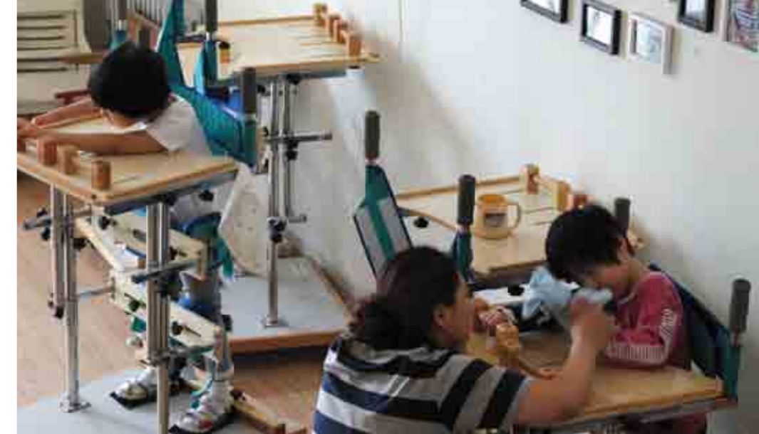
De fleste av barna har problemer med å gå og stå uten støtte.