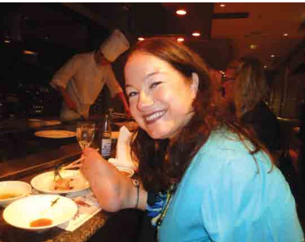
Lena Maria spiser med pinner - med tærne!

"nøkkelen til personlig fred" og opplysninger om artistene. I tillegg til store Gospel-sangernavn i USA som Alfie Silas, Mark Christian og John Lucas ble Lena Maria fra Sverige kalt til å synge på disse møtene. Lena Maria har et stort navn i Japan fra gammelt av. Ikke bare har hun en nydelig stemme, men hun har overvunnet sine utfordringer med å bli født uten armer og en fot i halv størrelse. Som ung var hun med i paraolympics og tok gull i et verdensmesterskap. Nå er hun også