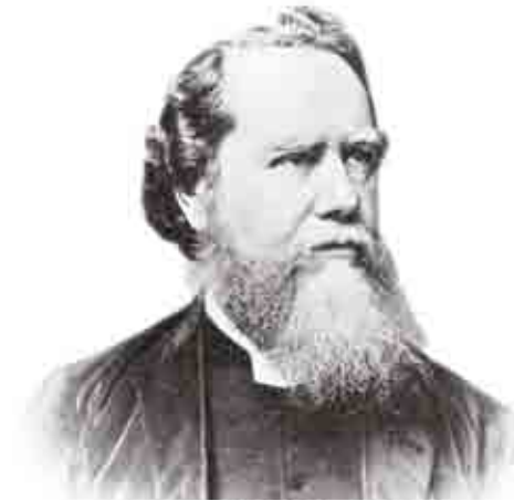
James Hudson Taylor (1832-1905)

Sammenfallende med misjonsengasjementet i Norge var en gjennomgripende