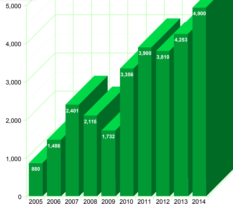
GAVEINNTEKTER oppgitt i 1000 kr

behjelpelig med sekretærarbeid og hjulpet med å sende ut takkebrev til givere. Vårt blad "Asias millioner" har nå 2908 abonnenter på bladet. Det er første gang på mange år at det har vært en stagnasjon i antall abonnenter. Dette er litt bekymringsfullt, men vi må erkjenne at yngre generasjoner ikke leser blad i samme grad som eldre. Vår hjemmeside www.eom.no har hatt over 2000 treff. Vi har en Facebook-side. Vi har produsert videosnutter som er lagt ut på hjemmesiden og Facebook-siden. Dette er en ny og fremtidsrettet måte å kommunisere med støtteapparatet på.