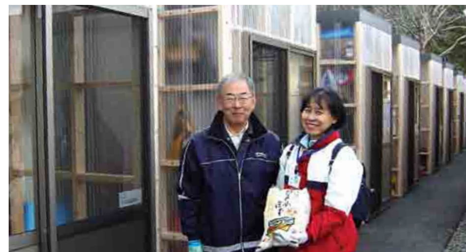
Provisoriske bygninger for de katastroferammede..

På minnedagen var våre folk på plass i Iwakis mest ødelagte landsby, Usuiso, og deltok i serveringen av en kjempelunsj til mennesker som var