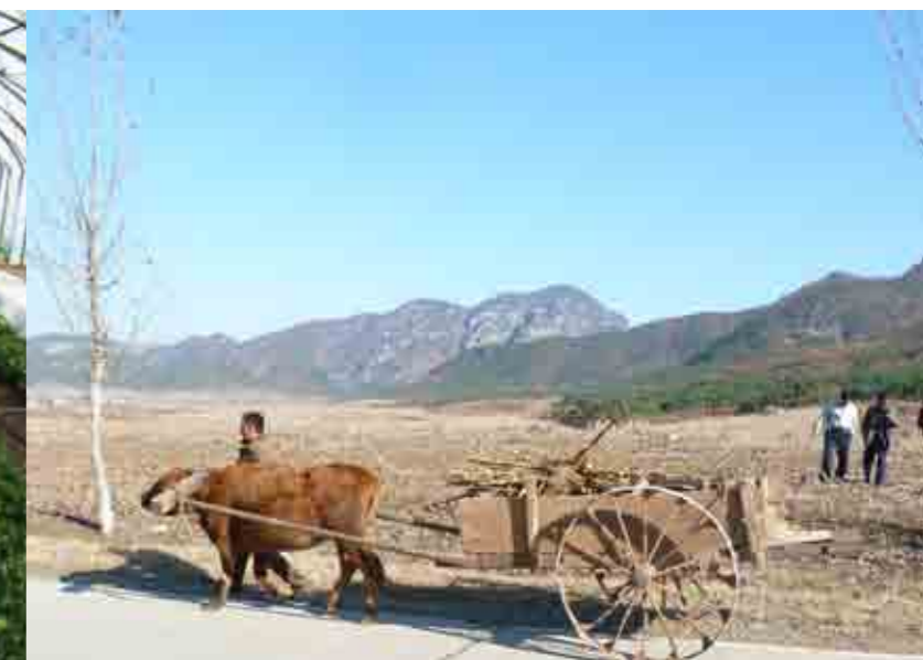
Nord-Korea er lite utnyttet som jordbruksland. Drivhusprosjektet er derfor livsviktig for de sykehusene som drar nytte av det.