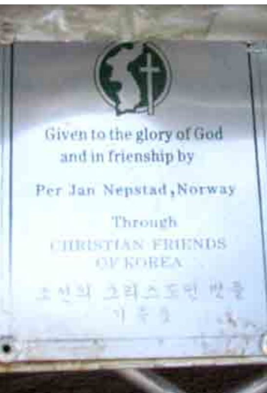
Alle som gir et drivhus får navnet sitt på en plakett på et drivhus inne i Nord-Korea.

– Det er ikke befolkningen som truer verden med atomkrig