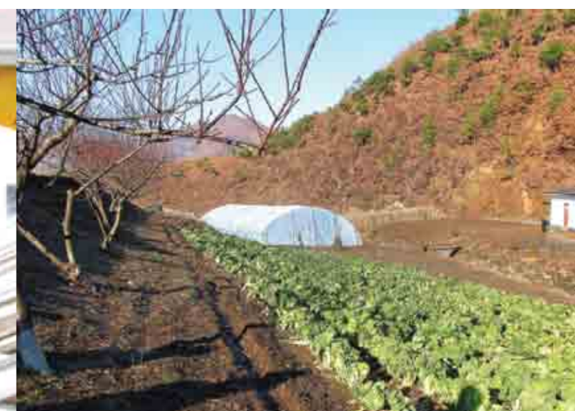
EOM har til nå finansiert 61 drivhus i det nødlidende landet.