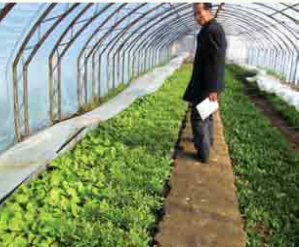
Drivhus til Nord-Korea