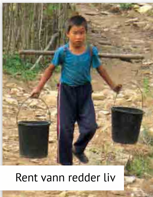
Rent vann redder liv

Grønnsaker er et livsviktig kosttilskudd for mennesker som lider av underernæring. Under matmangel svekkes immunforsvaret og det fører til en rekke sykdommer, særlig tuberkulose. Med din støtte kan vi også hjelpe dem som er smittet av tuberkulose.