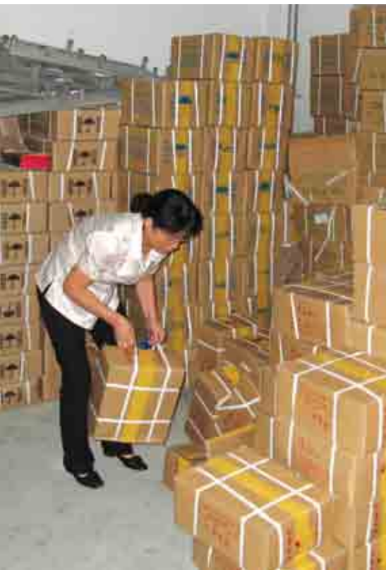
Tonnevis av Bibler importeres til Kina hvert år.