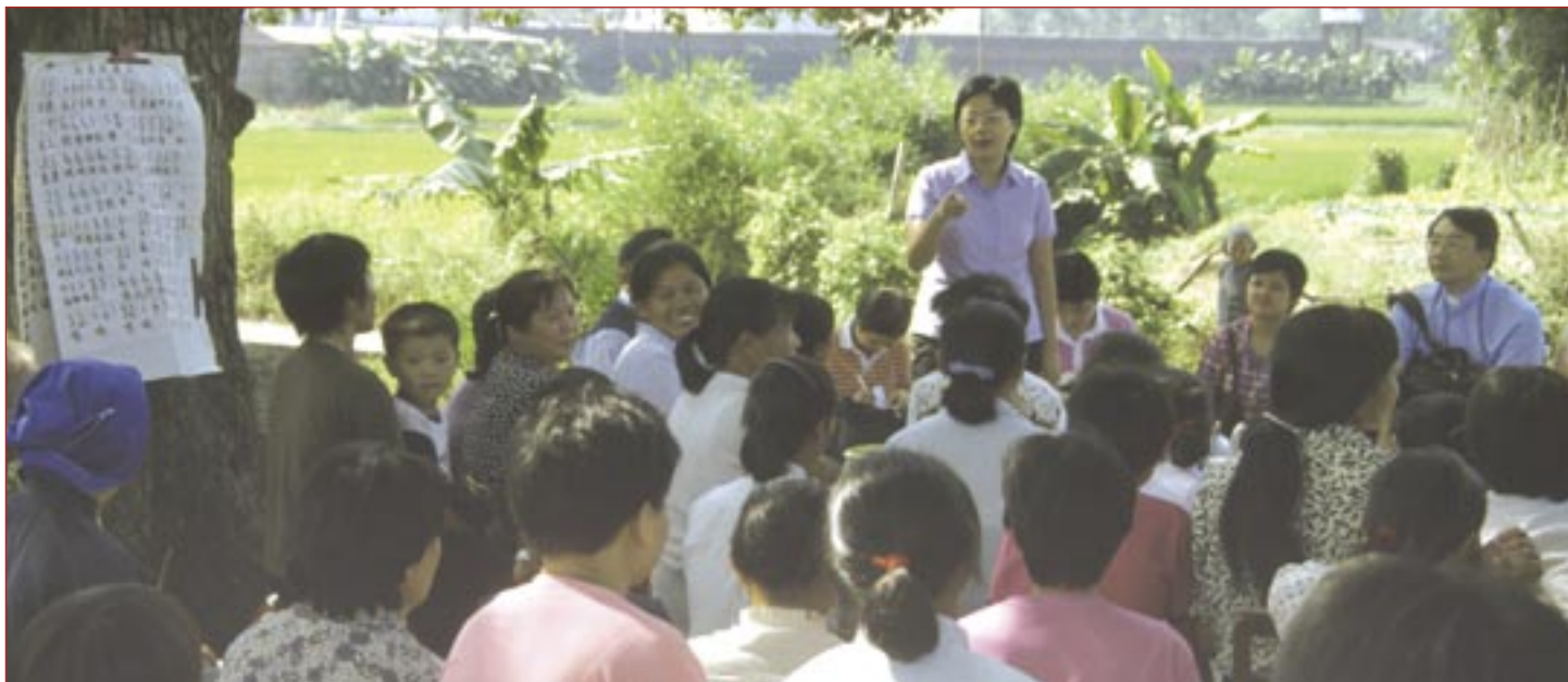
En uregistrert menighet samles i det fri.

kinesere tilhørte den protestantiske tro. I dag er ca 25 millioner registrert i Tre-selv-kirken og i tillegg kommer husmenighetene. Antallet kristne tilsluttet disse er svært usikkert, men Harbakk mener at man med rimelig sikkerhet kan anslå i alle fall rundt 30 millioner. Andre opererer med langt høyere tall. – Bare i Beijing regner myndighetene med at det er rundt 3 000 slike husfelleskap, sier Harbakk og mener at det var til velsignelse for kirken at misjonen måtte trekke seg ut. Kristendommen har blitt kinesifisert og oppfattes slik som en del av den kinesiske verden. Mange av de kinesiske husmenighetene er organisert i store nettverk som kan telle flere millioner mennesker og tusenvis av menigheter. Noen av dem kan ha flere hundre medlemmer, andre bare 15-30 personer. Og nettverkene vokser fort til tross for motstanden.