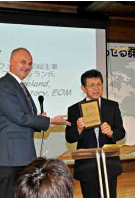
Overrekkelse av plakett fra EOM: "Gratulerer med ny kirke. Hittil har Herren hjulpet."

Det var stor høytidelighet ved åpningen av det nye store bygget til Global Mission Centre i Iwaki lørdag 29.september. Gjester fra fjern og nær var samlet for å feire begivenheten.