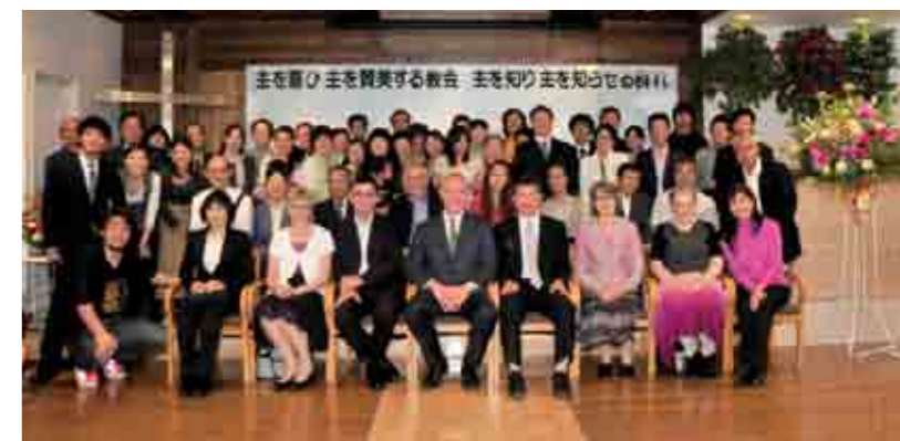
Det nye Global Mission Center.