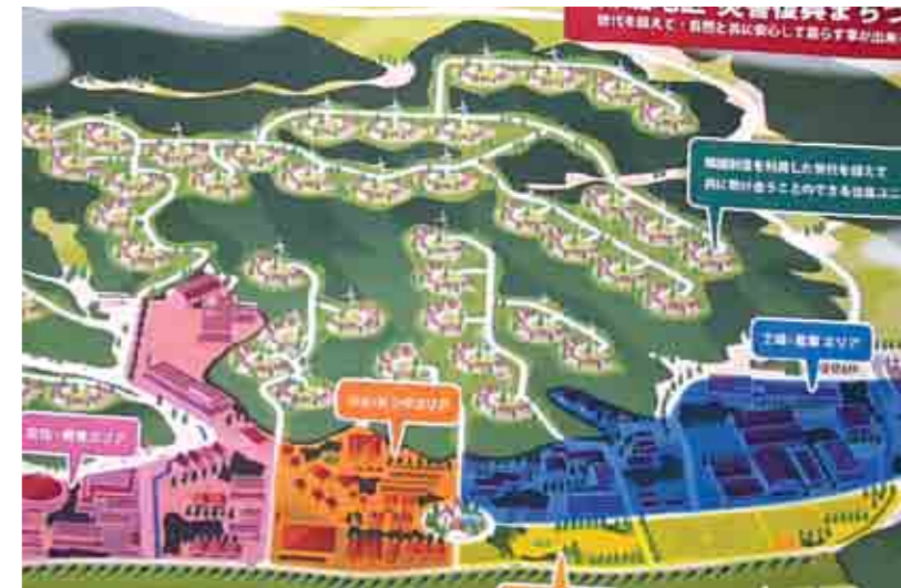
Planskissen over de nye boligene.

er å kunne tilby bolig til folk som ble rammet av tsunamien i fjor. Dette er et stort prosjekt som gjennomføres i samarbeid med lokale myndigheter og vil være veldig kapitalkrevende. Akira har fått gaveløfter i millionklassen og er overbevist om at dette er en visjon fra Gud.