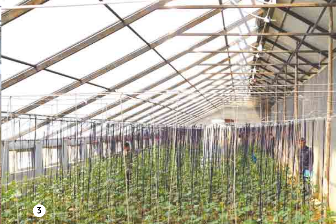
1: Staben på kooperativbruket i Chu Tang. Svenn Erik i midten. 2: Vara-ordføreren i Kosan (med spade) besøker drivhusanlegget. Ketil Fuglestad til høyre gir opplæring i drivhusproduksjon. 3: Tomatplaner på god vei. 4: Kvinnelig arbeider som vedlikeholder tomatplantene.

Landbruksdepartementet ønsker å øke antall kvadratmeter drivhus i landet fra 1 million m 2 til 10 millioner m 2 .