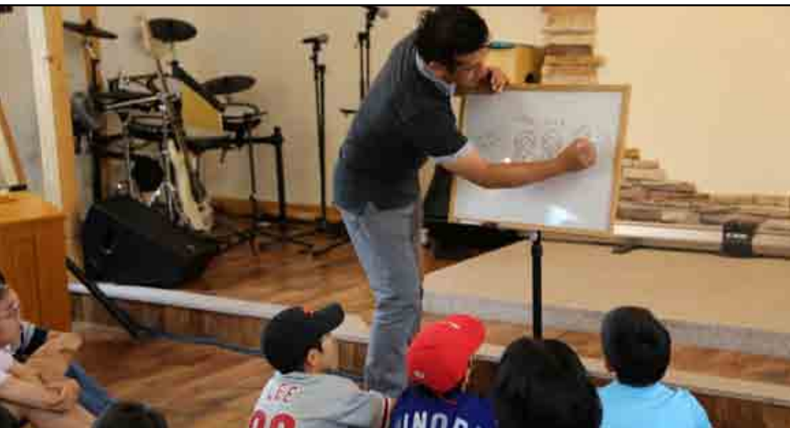
Søndagskolen i Home Chapel

i byen sammen på en ny måte og det preger stadig kirkelivet i byen. Katastrofen i 2011 førte menighetene i Iwaki enda tettere sammen og uten ESC historien hadde dette trolig vært vanskeligere å få til. ESC gjorde også at det oppstod et fornyet fokus på å nå nye mennesker, å nå ut i sitt lokalmiljø og særlig til de unge.