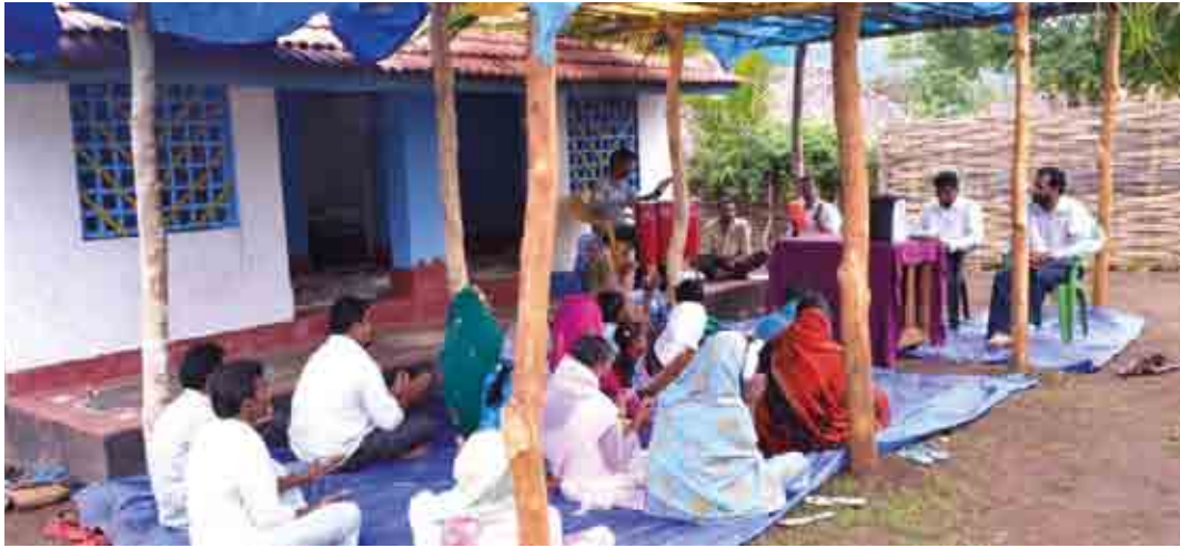
Besøk i menighet i jungelen i India.