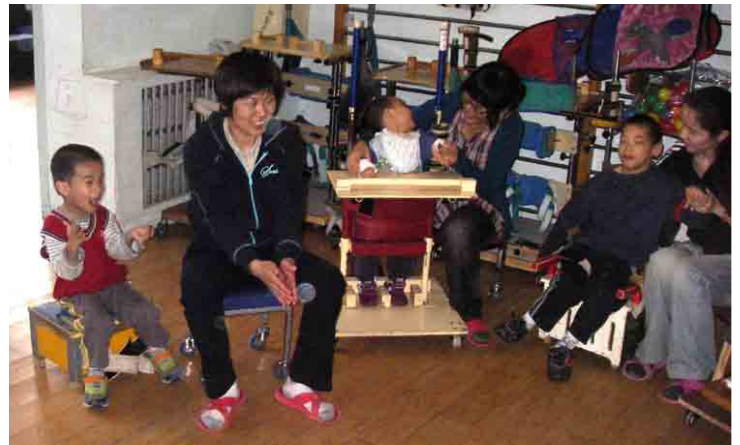
Lek. På dette barnehjemmet som drives av kristne får barna mye kjærlighet og blir tatt godt hånd om.

Hovedhensikten med turen min var å besøke noen av prosjektene og treffe representanter for samarbeidsorganisasjoner. Det er inspirerende å se driften på barnehjemmet som vi støtter. Her er 36 barn med cerebral parese. Et av barna døde i januar. Mange av disse barna er hardt rammet og alle er foreldreløse.