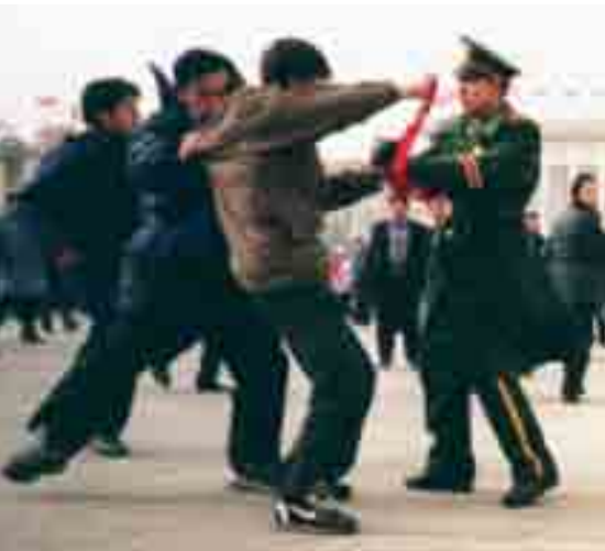
Voldelig. Kinesiske myndigheter er kjent for sin uvennlige håndtering.

– Som kristne i den frie del av verden, må vi være med å støtte de som blir forfulgt.