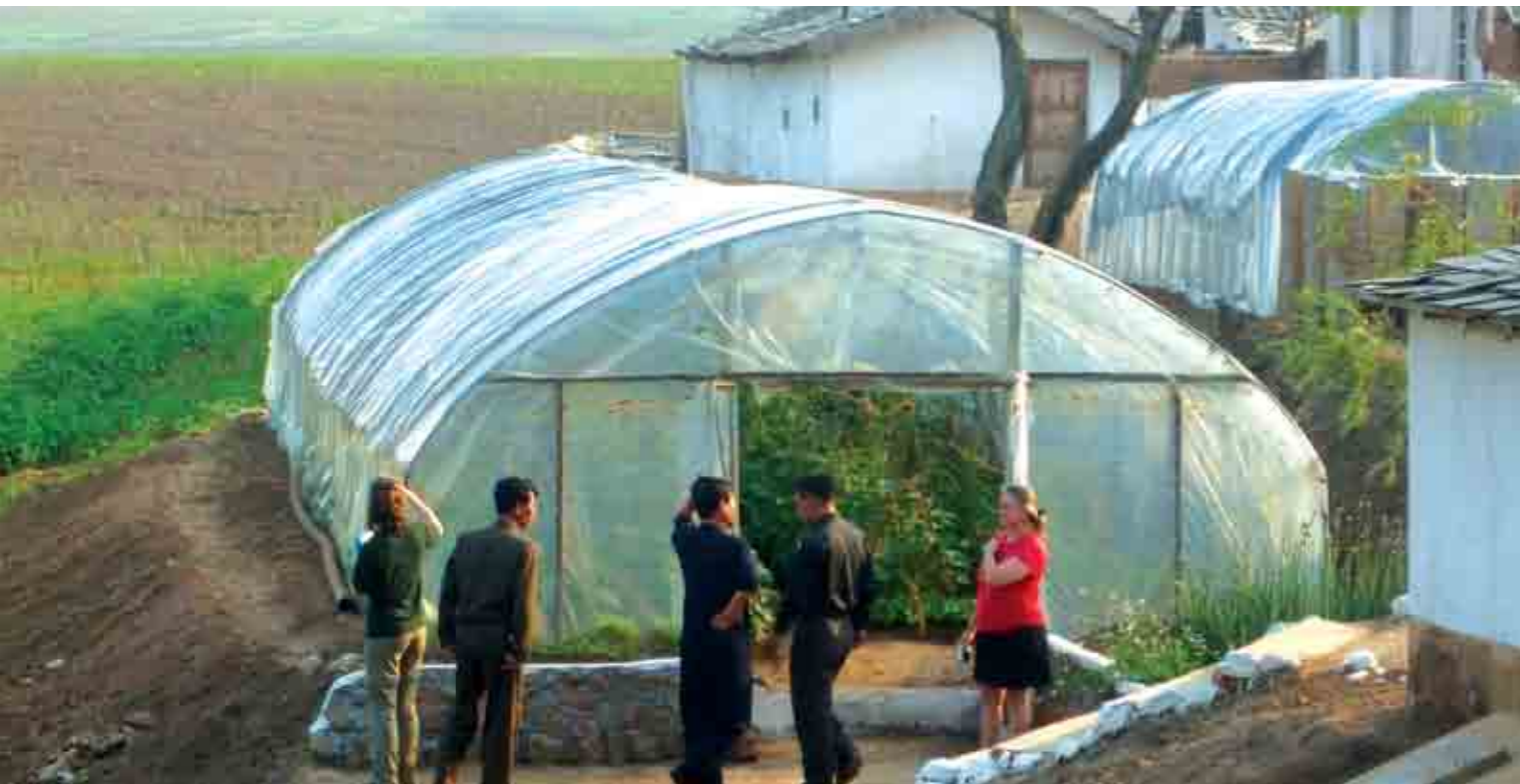
Verdifullt. Delegasjonen fikk bygd flere drivhus som gir nødvendig mat.