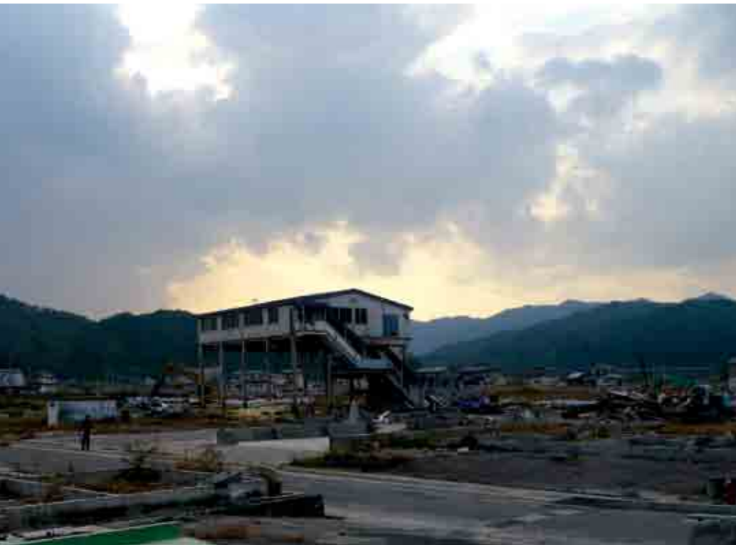
Ødeleggelsene er betydelige i Kesenumma.

sett maken til, som ingen menneskelig foranstaltning kunne stå seg imot, tok plutselig tak i landområdene, og rystet, knuste og la i grus det meste av det mennesker hadde bygget opp. Tilbake lå et virvar av livløse mennesker, ødelagte bygninger, ramponerte biler, båter kastet langt på land - og knuste håp. Overlevende lette i fortvilelse etter sine kjære, uten noe hjem lenger, uten arbeid å gå til, uten inntekt - uten noe sikkert å håpe på for framtida. Over alt dette lå den kvelende frykten for radioaktiv stråling.