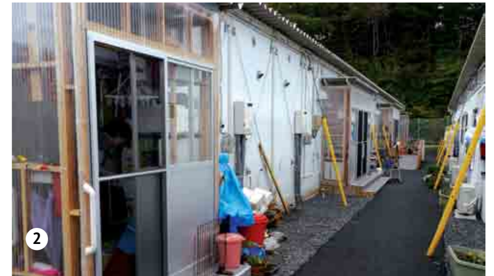
1. Leirbeboere i Miyako lytter til sang 2. Midlertidig interneringsleir i Miyako.

at hjelpearbeidet som drives fra sentraler som Global Mission Center i Iwaki fører til at mennesker kommer i kontakt med Guds ord. Vi ser at oppmuntringstiltakene som den tidligere nedleggingstruede menigheten i Miyako og andre driver for de som bor i interneringsleirene, bereder grunnen for at mennesker får møte Jesus. Vi ser en ny giv blant de troende i disse områdene, ja, kanskje over store deler av Japan. Evangelisk litteratur blir tilbudt og