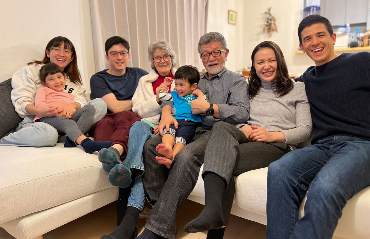
Familien Mori i Japan.

Flere av disse fullførte sin skolegang i løpet av fjoråret.