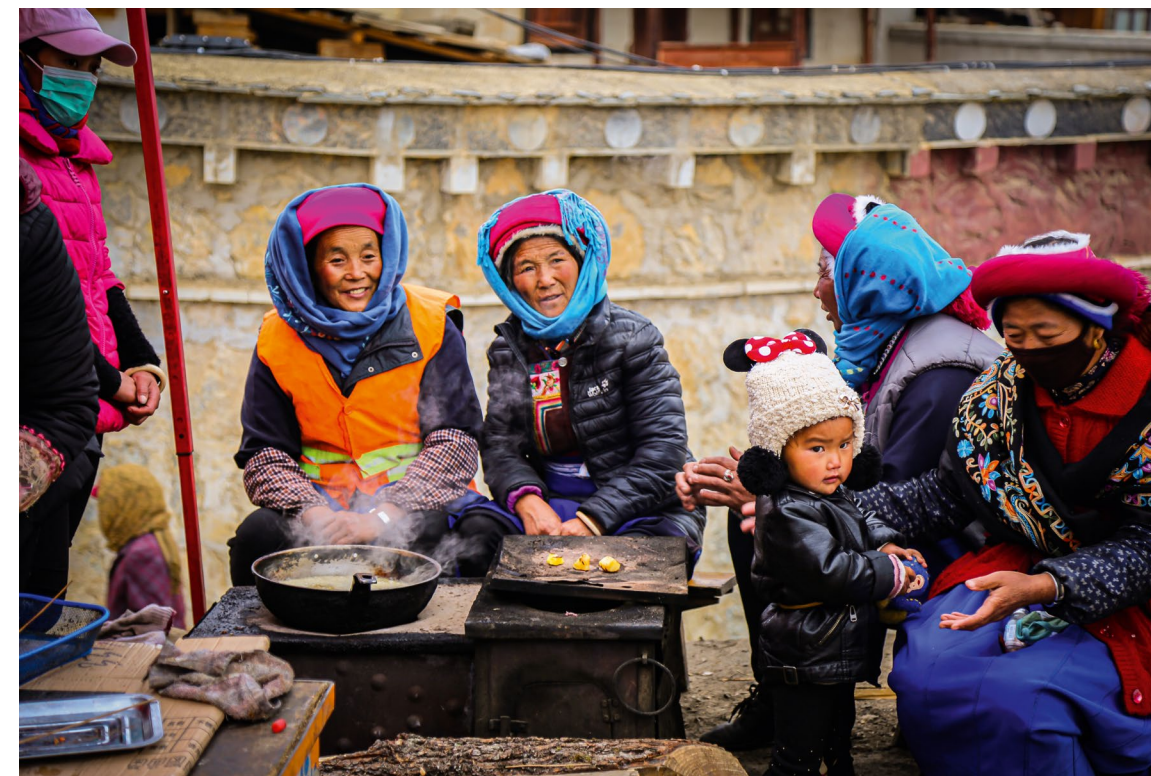
Fra landsbygda i Kina, illustrasjonsbilde.

Denne støtten er lagt opp som en fadderordning der noen av våre givere tar et årlig ansvar for skolepengene til en enkelt elev. Det har til sammen vært 29 familier som har fått hjelp gjennom dette prosjektet.