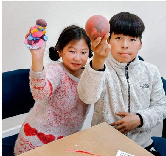
Fornøyde barn på dagsenteret.

Takket være disse gavene kan barna gå den kalde vinteren i møte uten å frykte for