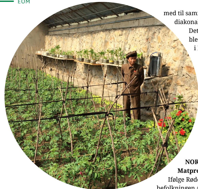
Inspisering av veksthus i Nord-Korea.

20-30 barn i menighetslokalet. Fra 1. aug. 22 begynte Åse Marit Hegland i EOM, og tok da også med seg MHFI inn i vår organisasjon.