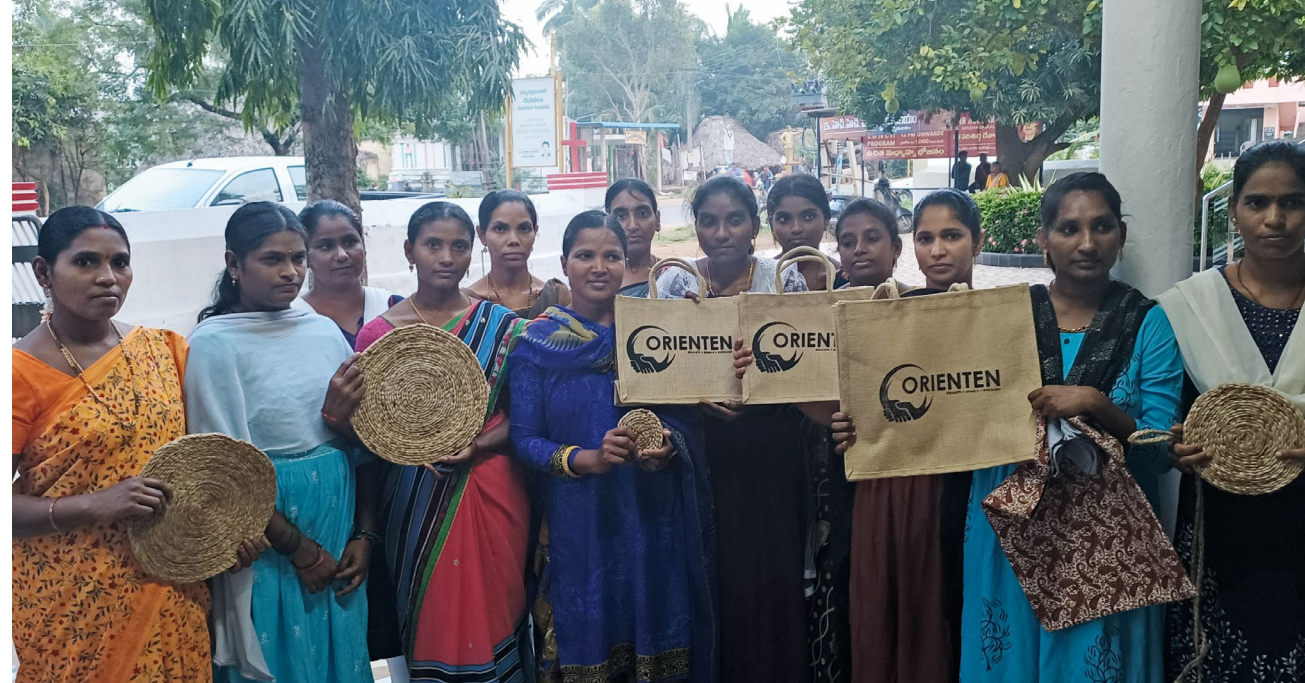
Kvinnene som lager produktene vi selger.