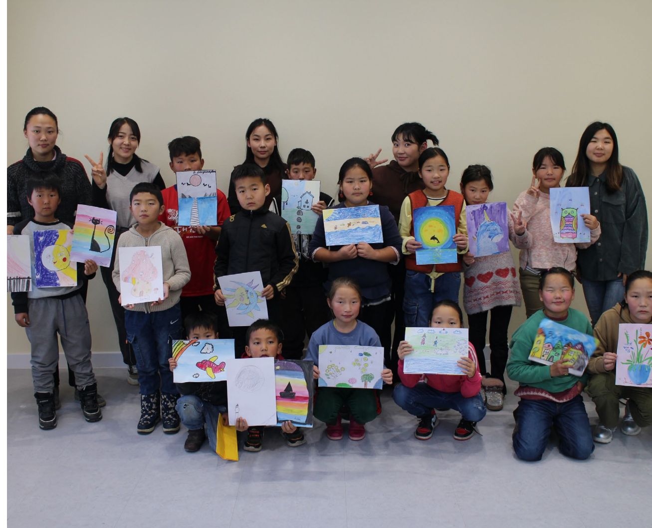
Noen av barna på dagsenteret viser hva de har tegnet.

kulden, og disse gavene ble til stor glede for barna.