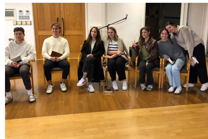
Teamet samlet i kirken.

Hun var veldig klar på at hun ønsket å komme igjen.