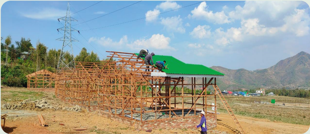
Byggingen er alt i gang.

Hver bolig som bygges i Manipur koster kr 52.000,-. Du kan være med oss i dette viktige arbeidet. Sammen sprer vi håp!