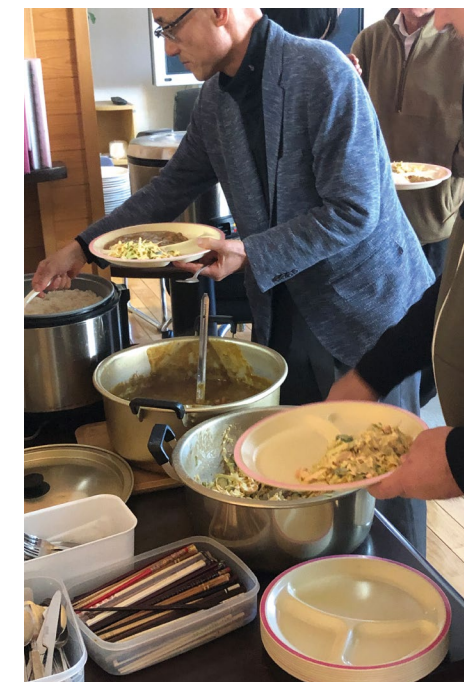
Teamet hjelper også med matlaging og annet praktisk arbeid.

Vi gleder oss over at menigheten i Taira legger til rette for slike besøk av ungdom som ønsker å stå med i arbeidet for en stund. Vi håper på at vi i en nær fremtid også kan ha et nytt team her fra Norge med i denne type korttidstjeneste.