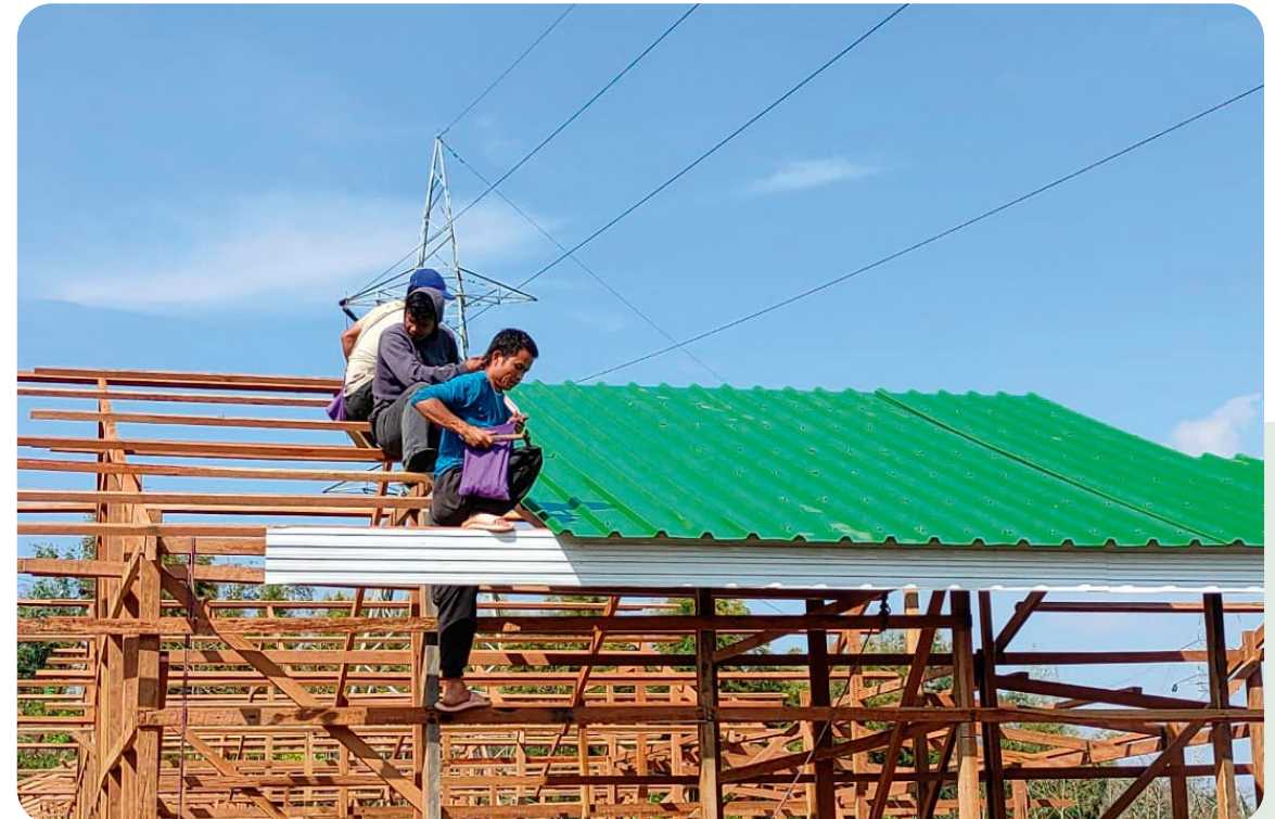
Arbeidet er allerede godt i gang.

Vi lever i en tid med stor informasjonsflyt, og også mange rystende hendelser rundt om i verden. Det er derfor viktig at vi fortsetter å holde frem forhold som fortsatt bør engasjere oss. Et slikt forhold er situasjonen for de kristne i Manipur.