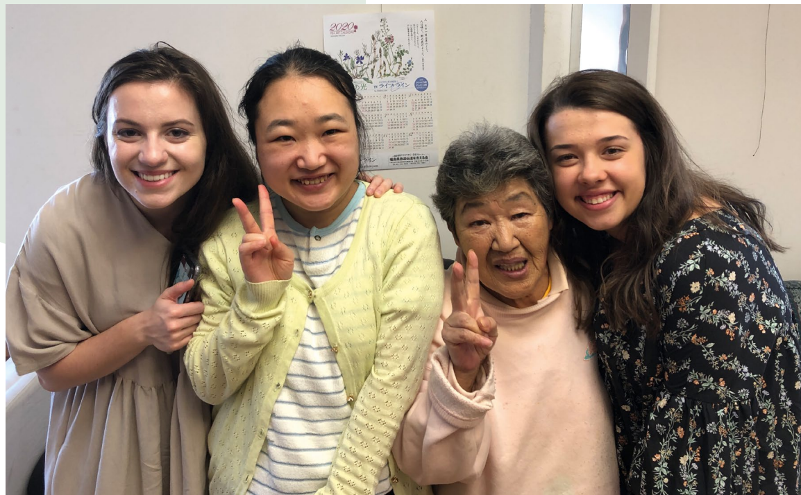
To fra teamet sammen med nye japanske venner.

Arbeidet til Global Mission Center i Taira er preget av et betydelig mangfold og at mange forskjellige mennesker er innom i lokalene.