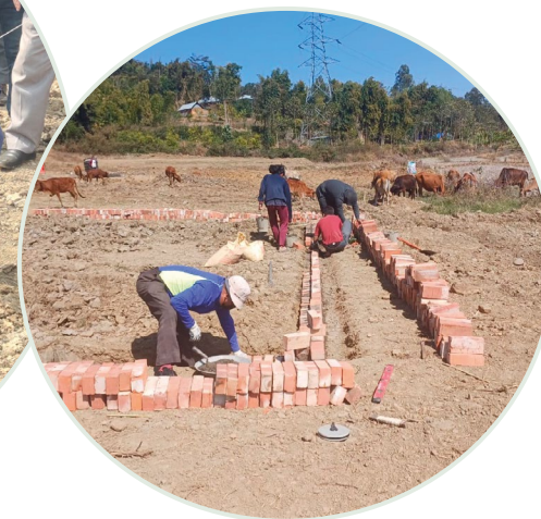
Straks seremonien med grunnsteinen var over, gikk arbeiderne i gang med byggingen.