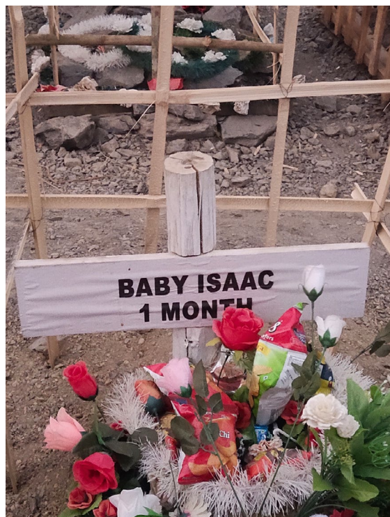
Noen av ofrene var nyfødte spebarn.