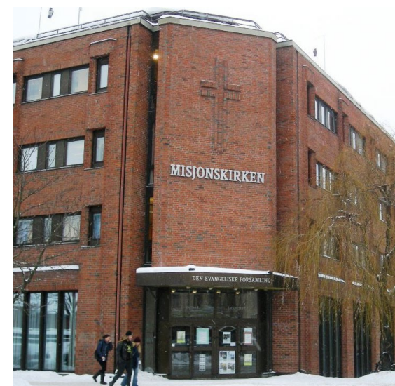
Snart forandres navnet på fasaden til HÅP.

Av flere årsaker ønsker nå menigheten å benytte seg av det langt kortere navnet HÅP, eller «Menigheten Håp». Menigheten ønsker å bygge et sterkt menighetsfelleskap og gjennom det gi håp til byen og samfunnet rundt seg.