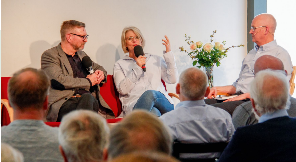
Gjester fra Sverige deler fra livet i Mongolia.

27. april var styre, stab og støttespillere samlet til årsmøte i Kristiansand. I misjonens lange historie var det første gang et årsmøte var lagt til et sted utenfor Oslo, men vi kunne fort konstatere at det var en upåklagelig deltagelse både på selve forhandlingene, og ikke minst på det etterfølgende, åpne misjonsmøtet.