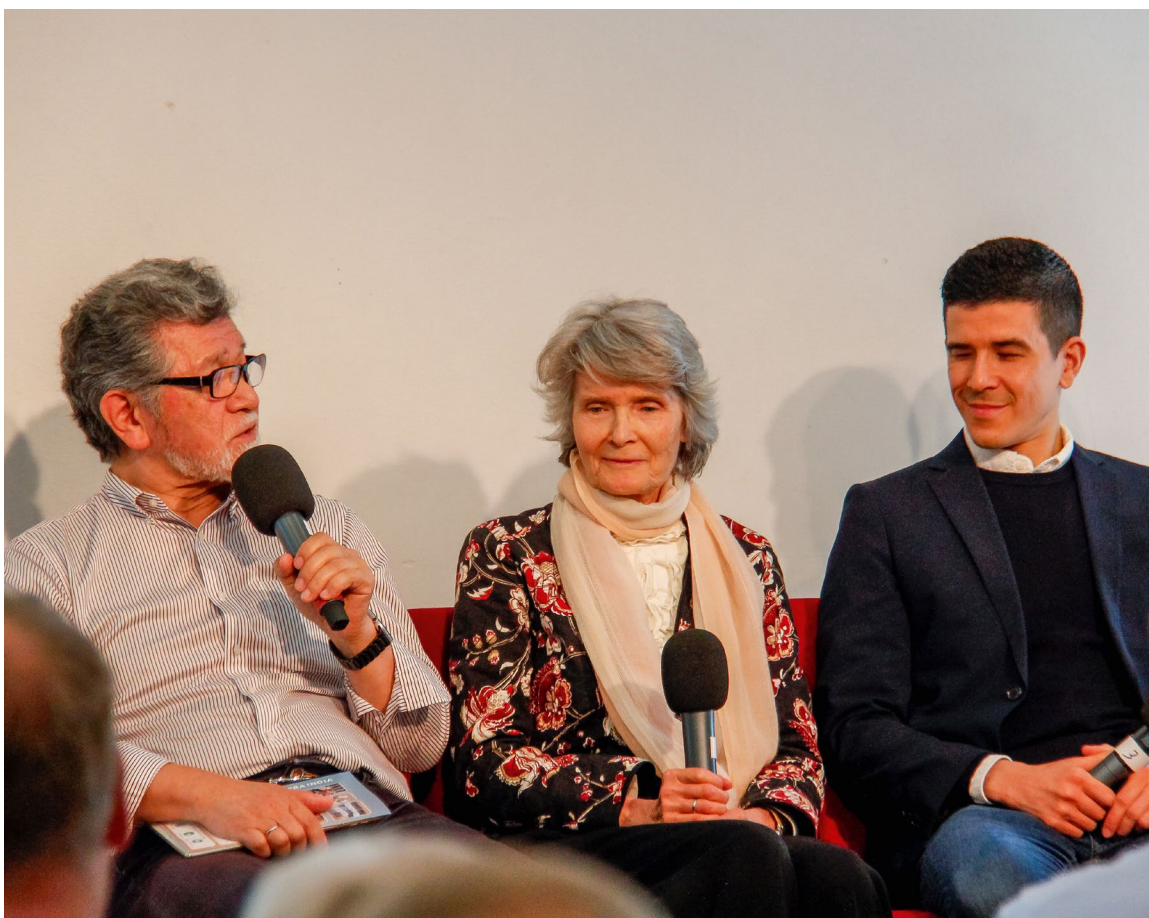
Familien Mori intervjues.