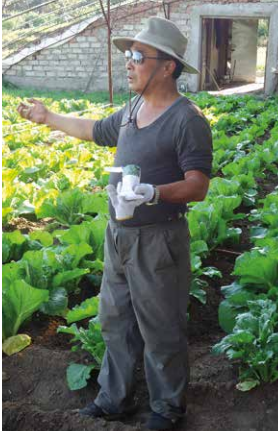
Spinatfrøene våre havnet i jorden med en gang.

Vi takket farvel med et ønske om en dag å få vende tilbake til denne lille oasen. Der de alle på sin måte får være med i det samme