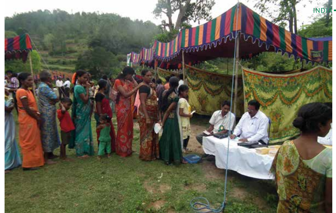
Køen er lang når kvinnene i landsbyen endelig får sjansen til å komme til en lege for sine problemer.

Helping Hand (EHH) og Bethel Assembly (BA) har hatt når det gjelder nye menigheter og antall døpte. Dette er selvsagt noe vi gleder oss over. Hånd i hånd med Ordets