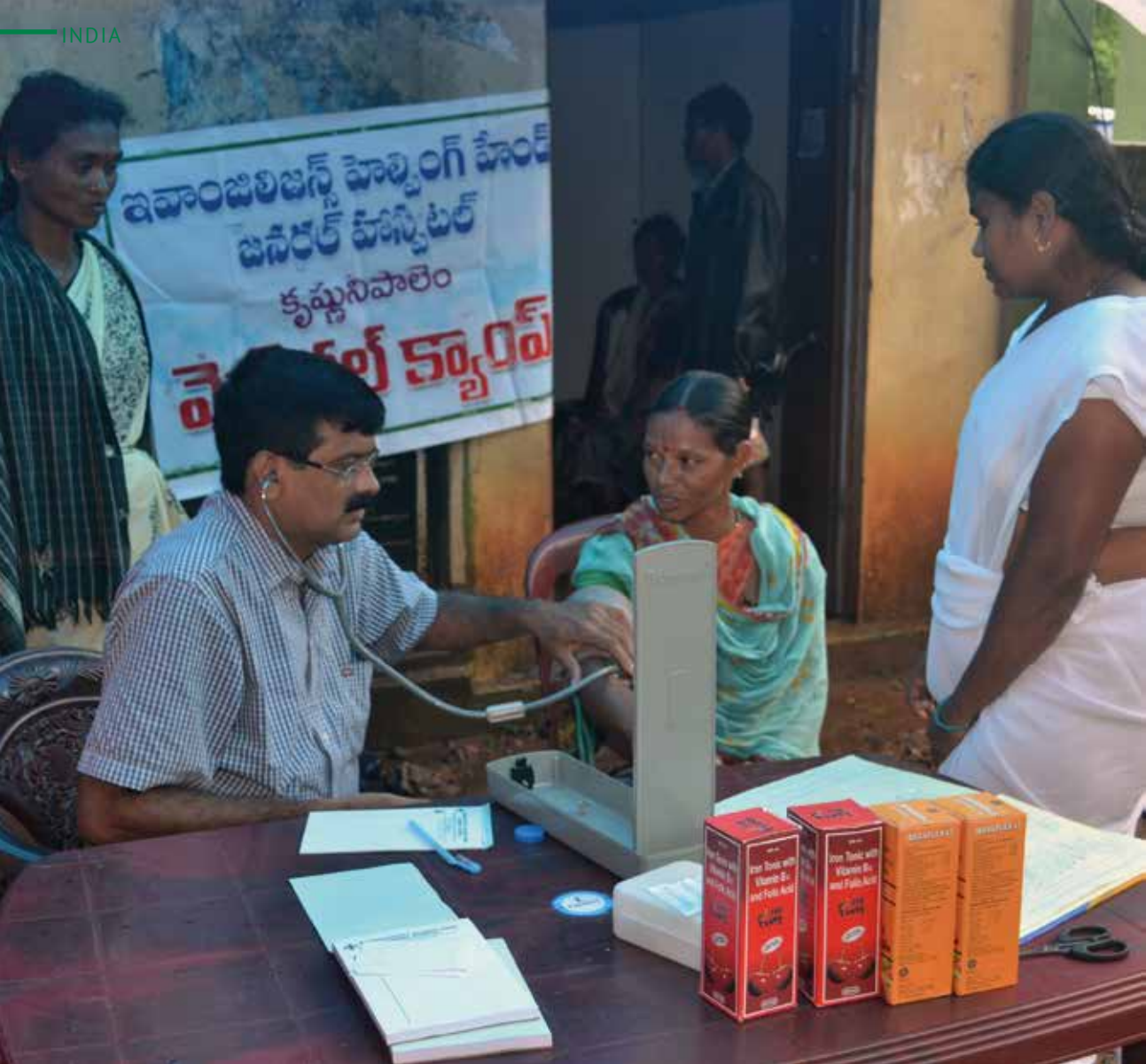
Legen fra EHH måler blodtrykket på en kvinnelig pasient.