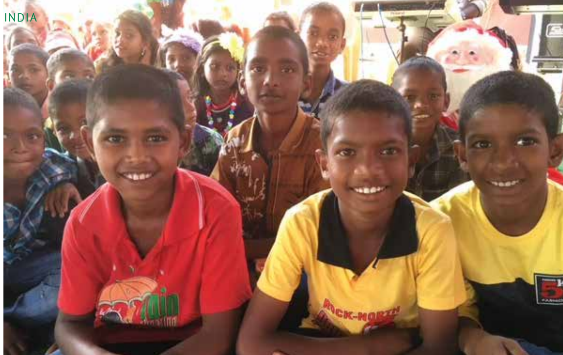
Barnehjennene vi støtter har en åpen dør for unger som trenger et sted å bo. Her får de god omsorg.