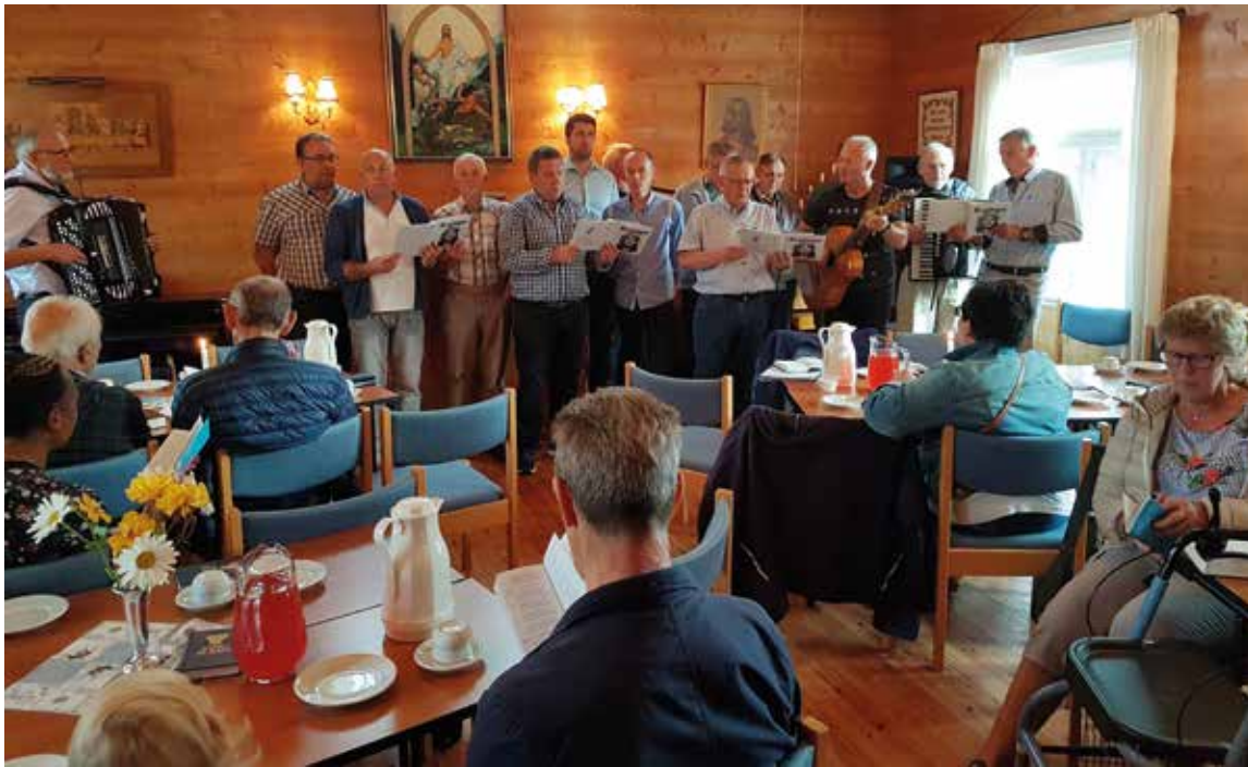
En gang i måneden samles Be-gjengen og synger på ulike bedehus. Kollekten gir de til EOMs arbeid.