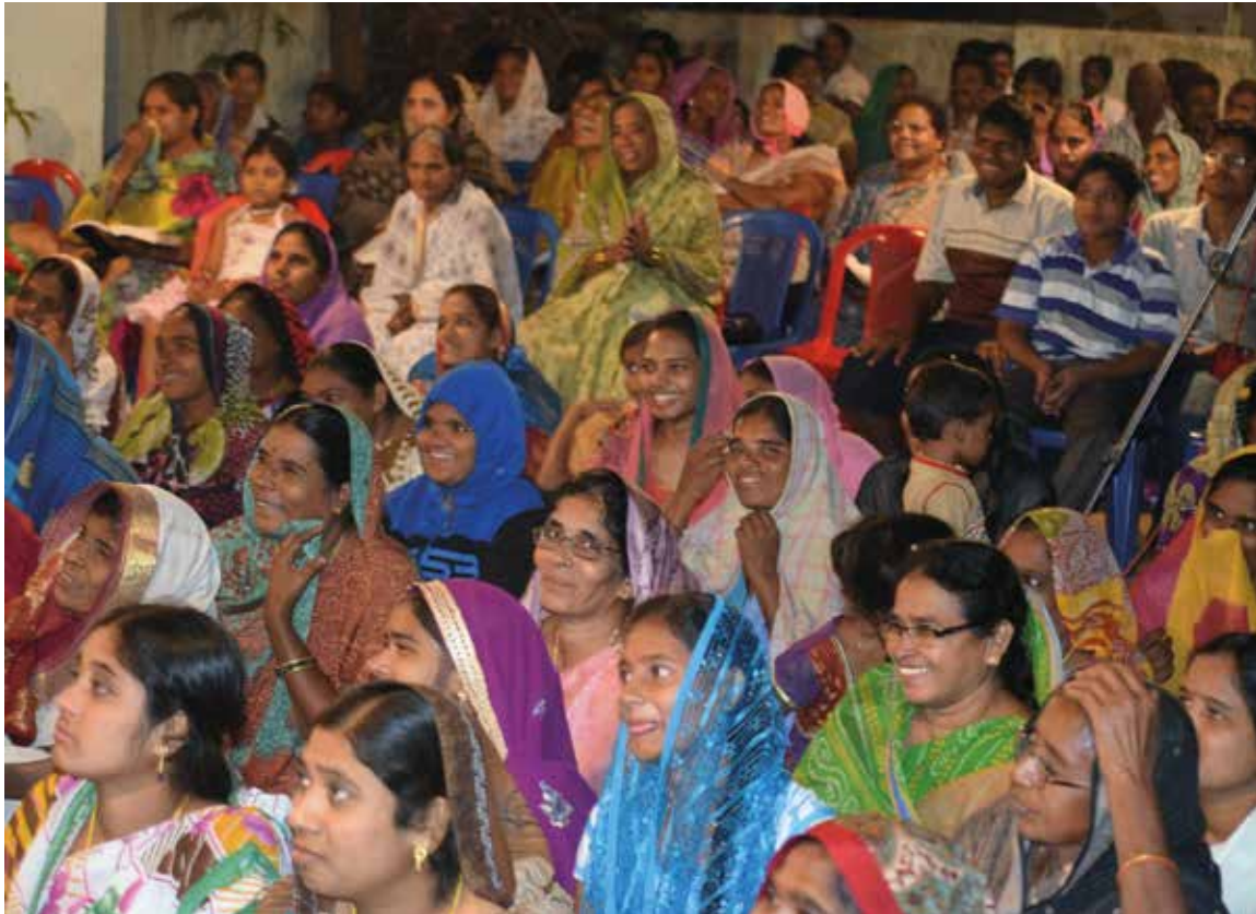
Vi støtter cirka 500 bibelkvinner, evangelister og pastorer i delstatene Andhra Pradesh og Telangana.

EOM har som sin visjon; «Å nå de minst nådde i Asia med evangeliet». I så måte er dette et meget strategisk prosjekt.