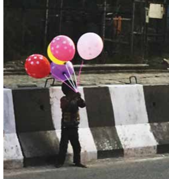
Gutten med de få fargeglade ballongene.

Da er det så godt å få komme til våre to barnehjem i Ginnepalli og Krishnunipalem. Der har det vært en åpen dør for unger som trenger et trygt hjem. Her har de fått masse