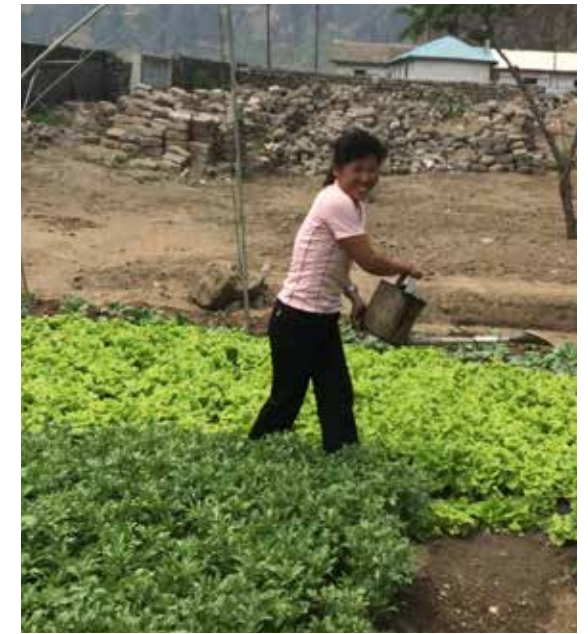
Vi gleder oss over gode avlinger.

Vi har derfor stor tro på, og frimodighet for, det viktige arbeidet som her har blitt oss betrodd. Og vi håper at mange vil stå med oss fortsatt også i denne delen av vingården.