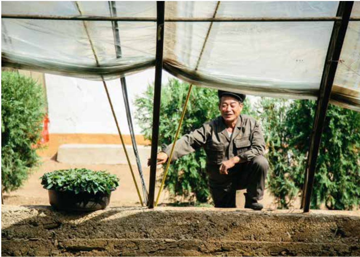
Der er godt å se at arbeidet gror i Nord-Korea.

Vi har nå fått en viss klarhet i situasjonen i deler av det arbeidet vi støtter i Nord-Korea, og vi ønsker igjen å rette fokus mot de store behovene vi utfordres på med tanke på å skaffe næringsrik mat og rent vann.