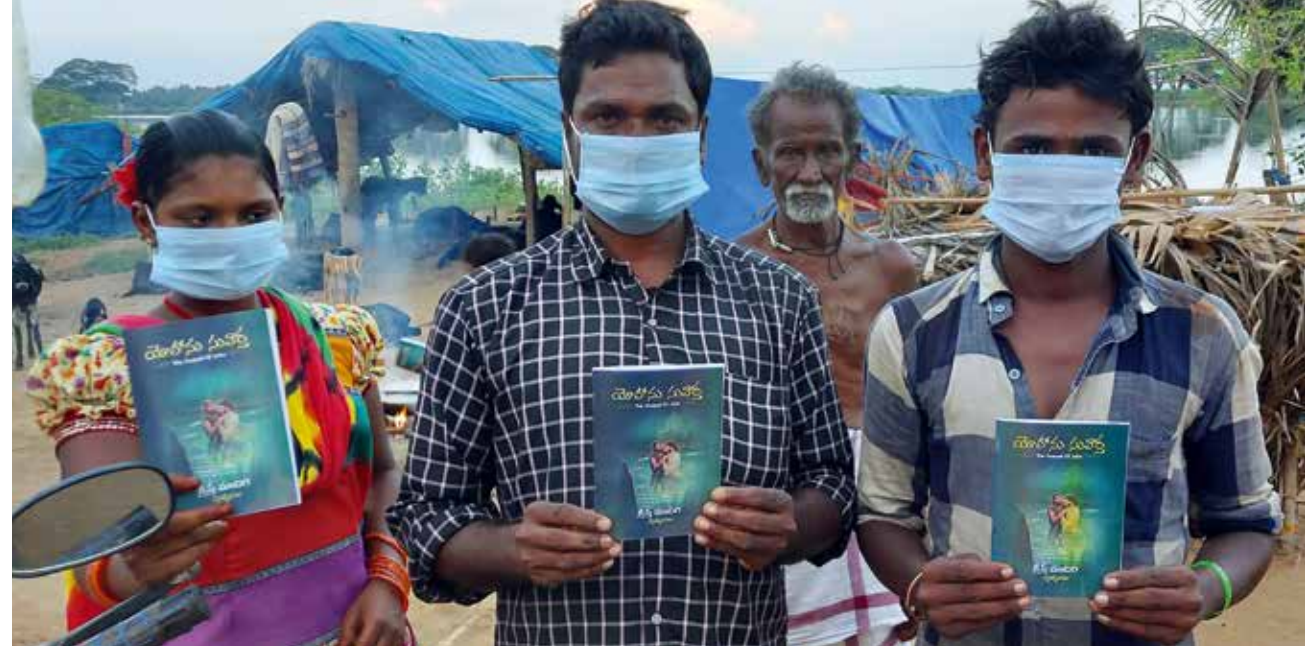
Johannesevangeliet har nå blitt delt ut i flere landsbyer.