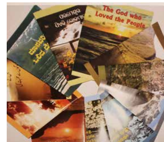
Noen av heftene med bibeldeler som har blitt trykket.