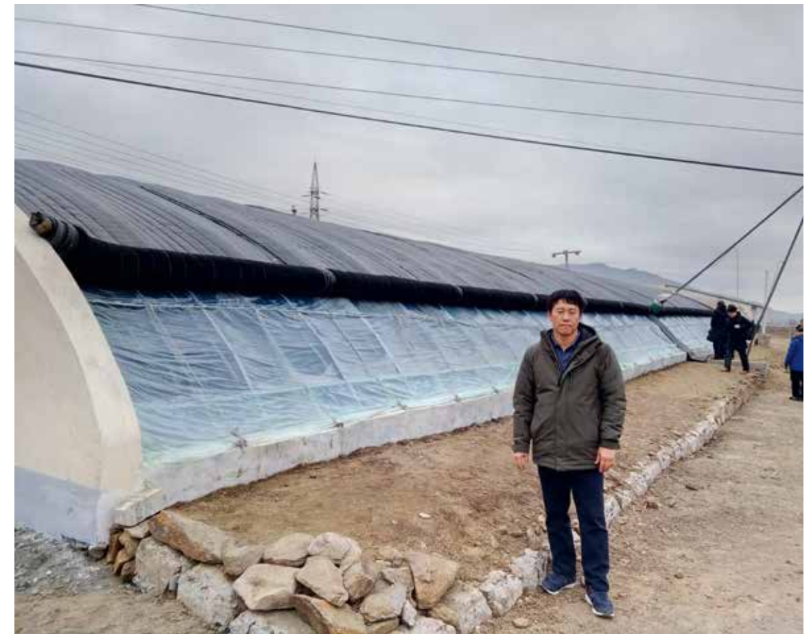
Det er store veksthus av denne typen og tilhørende utstyr vi nylig har sendt 800.000 kroner til.