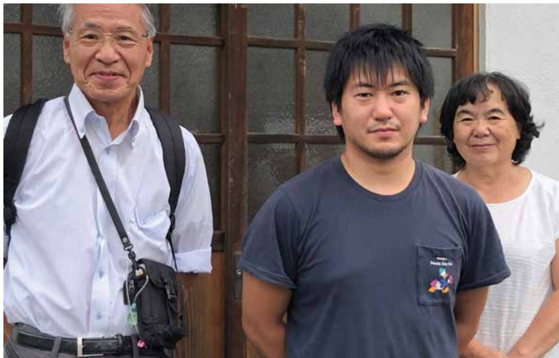
Pastor Ohira i Takahagi sammen med kone og sønn