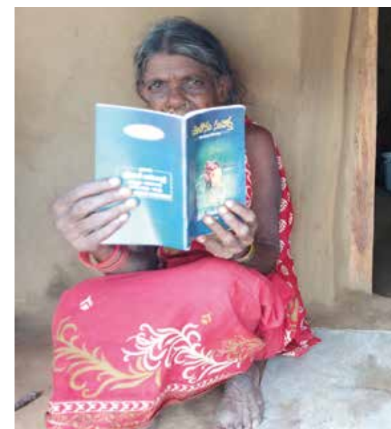
Endelig kan denne eldre damen lese om Jesus på eget språk.

Vi takker alle som ble med på dette og ber om forbønn for det viktige arbeidet som gjenstår, nemlig det å få ut heftene til de som trenger det. Vær også med å be om at de som nå får lese Johannesevangeliet på eget språk må bli berørte og få et personlig møte med Jesus gjennom det de leser.