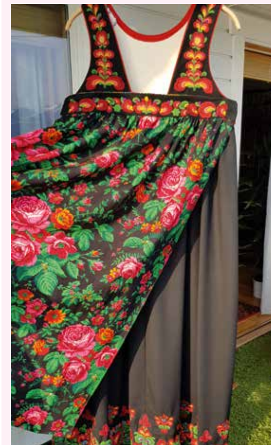
Giveren ville være anonym, men sendte oss bilde av bunaden.

Vedkommende som har vært brennende opptatt av misjon i Asia i over 45 år ønsket at pengene skulle gå til det arbeidet vi støtter i Nord-Korea. Hun ville gjerne bruke 20.000 på et nytt veksthus og 6000 kroner til frø. Fantastisk å tenke på at et festplagg fra Norge kan gi mat og fornyet livsmot til en svært stor menneskemengde i Nord-Korea.