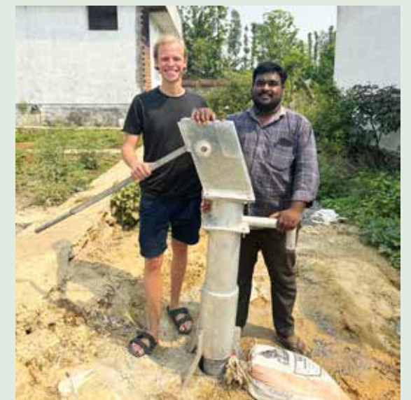
Klart for pumping av friskt vann.