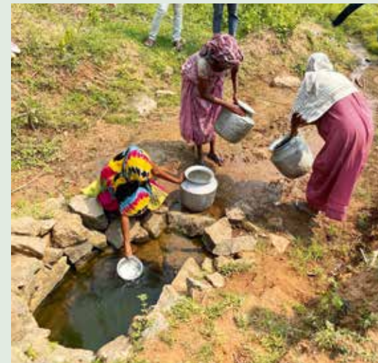
Landsbykvinner henter vann i den gamle kilden.