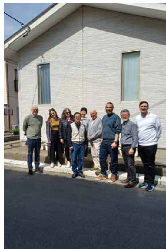
Gruppen foran kirken i Yoshima.

Vi kommer tilbake med mer fra turen i neste nummer av Asias Millioner.