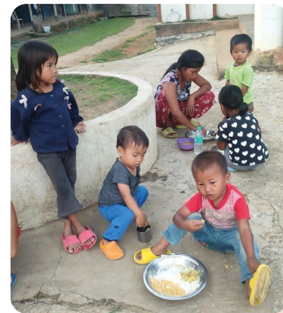
Barn i flyktingleir.

Deretter forsøkte jeg å motivere og styrke dem mentalt og åndelig. De fikk god mat og et lite pengebeløp. Jeg oppmuntret dem til å fortsette arbeidet med å hjelpe andre flyktninger. Pastorene viste stor