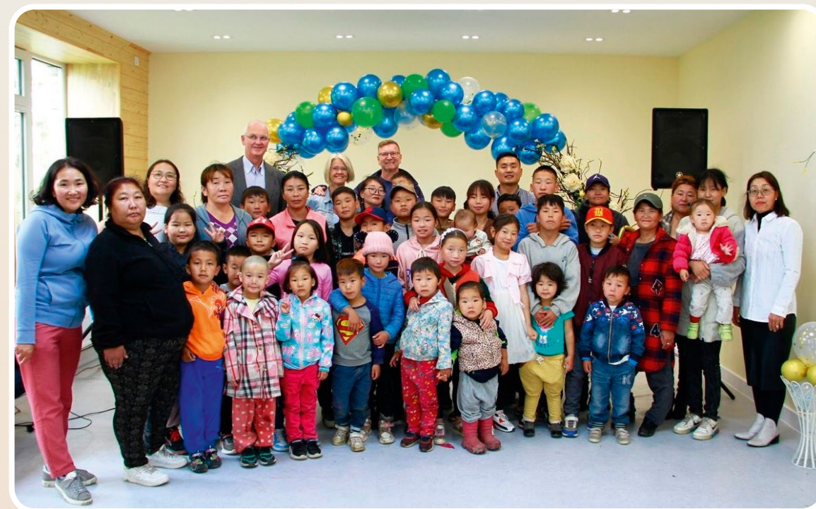
Noe av fruktene av arbeidet de startet i Mongolia. Innvielse av dagsenter for utsatte barn.