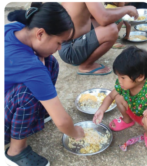
Her spises et måltid mat på bakken.

Det går mot vinter, og temperaturen var rundt 18 grader. Den vil gå ned til 10 grader i desember.