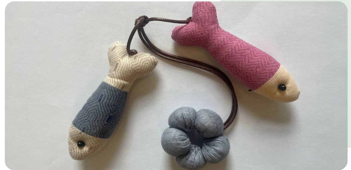
2 fisk og 5 brød

For en tid tilbake fikk jeg et lite håndverk produsert av en nordkoreansk flyktning som befinner seg i Kina. Hun flyktet delvis på grunn av undertrykkelse, men først og fremst på grunn av matmangel. Håndverket er to fisker og fem brød.